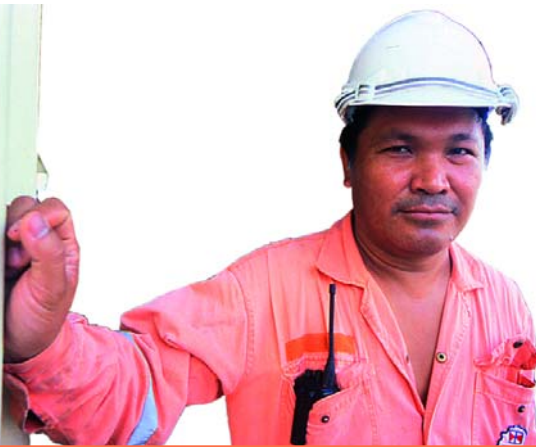
2004: IL MEETING DEI DIRITTI